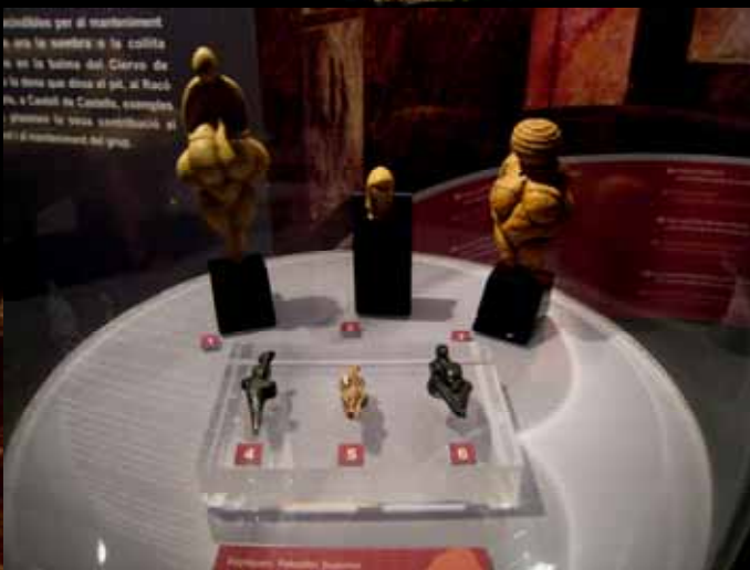
Reproducciones de arte mueble (Venus).

Junto a la agricultura, llegaron forzosamente nuevas tareas y tecnologías. Los molinos permitieron una alimentación más estable y rica.