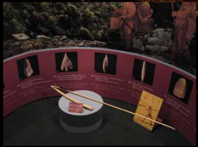
Lanza y propulsor de hueso.

La figura femenina fue primordial en el arte neolítico. La interpretación más común a estas figurillas es su uso religioso.