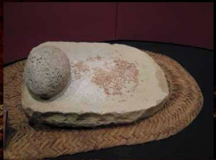
Molino de mano.

La agricultura supuso un gran cambio en las formas de vida de nuestros antepasados, incluyendo una facilitación de la supervivencia.