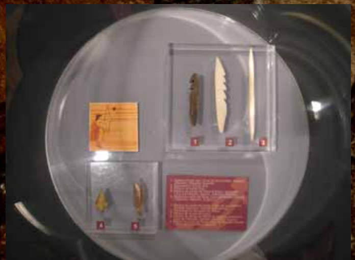
Arpones, punzones y puntas de flecha.

Nuestros antepasados eran religiosos, como demuestran sus enterramientos en los que hombres y mujeres eran tratados con los mismos honores.