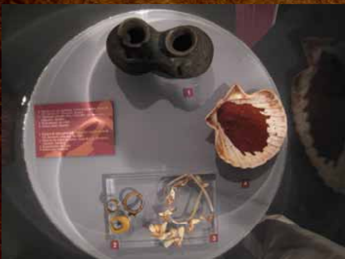
Objetos de joyería, vasijas y ocre.

Los propulsores eran una herramienta extremadamente efectiva, que reducía considerablemente la cantidad de fuerza física necesaria para la caza de grandes presas.