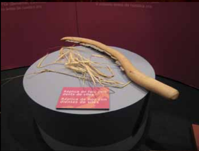
Reconstrucción de una hoz neolítica.

La agricultura supuso un gran cambio en las formas de vida de nuestros antepasados, incluyendo una facilitación de la supervivencia.